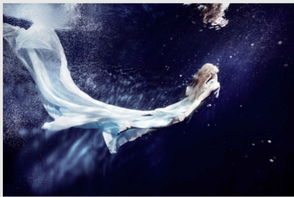
Подводные снимки от Susanne Stemmer

Как получилось сделать такие захватывающее подводные фотографии? Дайвинг - ваше хобби или необходимый рабочий инструмент? Susanne Stemmer: Я занимаюсь дайвингом с 20 лет. И до недавнего времени это увлечение было одним из истоков моего вдохновения. Потом я начала снимать подводные погружения, но это быстро мне наскучило, поэтому было необходимо придумать что-то новое. Мне очень